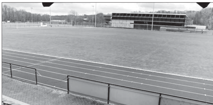
Hier passiert aktuell nichts mehr: Das Auenstadion Flöha ist wie auch alle anderen Sportstätten für sämtlichen Trainings- und Wettkampfbetrieb gesperrt.

Eigentlich wollten die Kicker des TSV Flöha in der Mittelsachsenliga versuchen, nach der Winterpause ihren Platz in der Spitzengruppe der Staffel zu verteidigen. Doch der Corona-Virus hat dafür gesorgt, dass die Punktspiele in diesem Jahr noch gar nicht angepfiffen worden sind. Zunächst hat die Spielleitung alle Partien bis zum 19. April abgesagt. Bei den dynamischen Entwicklungen der vergangenen Tage muss man jedoch davon ausgehen, dass der Ball auch nach diesem Datum nicht rollen wird. „Da auch die Sportstätten gesperrt sind, findet aktuell auch kein Training statt. Die Jungs sind angehalten, sich im Rahmen der Möglichkeiten fit zu halten, dass aber auf keinen Fall in der Gruppe, sondern nur einzeln zu machen“, sagte Trainer Mirko Schwoy. „Ich liebe den Fußball. Doch die schönste Nebensache der Welt ist jetzt erst einmal völlig in den Hintergrund gerückt. Jetzt sind andere Dinge viel wichtiger“, stellte der Flöhaer Coach klar.