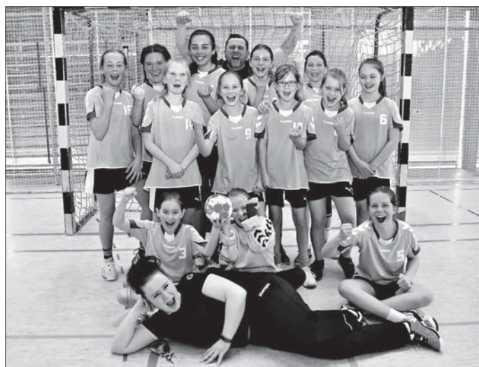
Nach dem 13:12-Heimsieg gegen den TSV Penig hatten die Handball-Mädels der weiblichen D-Jugend des VfB Flöha allen Grund zum Jubeln.

Der Handball-Verband-Sachsen hat unterdessen erklärt, dass die Saison in den Nachwuchsligen vorzeitig beendet ist. Somit können auch die Mädels der weiblichen D-Jugend des VfB Blau-Gelb Flöha in der Kreisliga nicht mehr in das Geschehen eingreifen. Dabei hatte das Team des Trainergespanns Stephanie Schulze – Gerlach/Rene Gerlach durch einen 13:12 (10:5) Heimsieg gegen den TSV Penig einen wichtigen Sieg im Kampf um den 3. Tabellenplatz erkämpft. Nach einem starken ersten Durchgang und einer 9:4 Führung nach 17 Minuten lief nach dem Seitenwechsel allerdings nicht mehr viel zusammen. Dennoch reichte es für den knappen Erfolg. Antonia Zschorn und Emilie